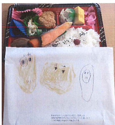
【朝日保育所の年長さん】