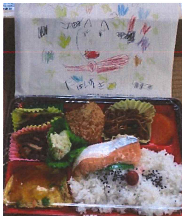
【只見保育所の年長さん】