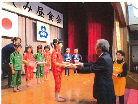
【明和保育所の年長さんが可愛い踊りを披露してくれました】