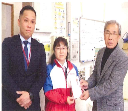
【会津ヤクルト販売株式会社 様】