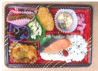
配達しているお弁当の一例