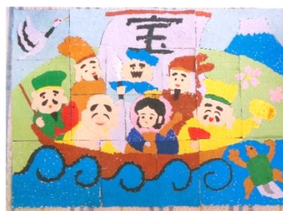
綺麗に完成！記念に集会場へ飾りました