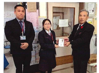
会津ヤクルト(株)様