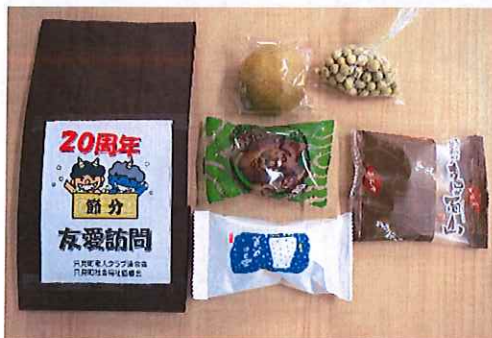
【三石屋さんの美味しいお菓子と煎り豆】

老人クラブの事業として、各会長さん方がお一人暮らしの会員の方を対象に、お一人お一人に「寒いなあ〜」、「元気があ〜？」とお声をかけながら訪問されました。