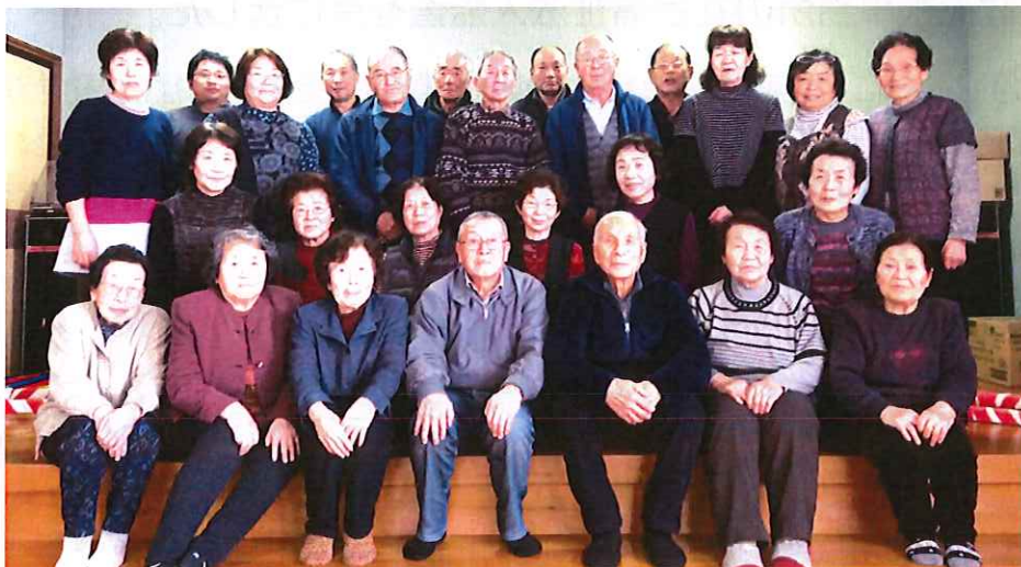
【あらまちサロンの皆さん】 ※名称は「あらまちサロン」