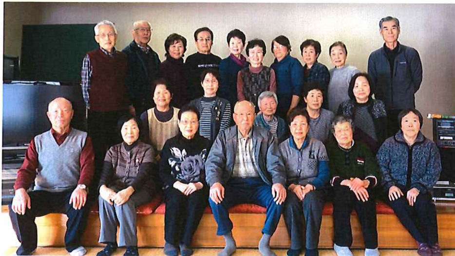
【黒谷蓮の華サロンの皆さん】 ※名称は「蓮の華サロン」