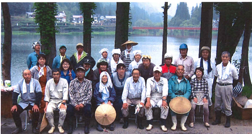
【しおの里サロンの皆さん(塩沢・十島地区)】☞