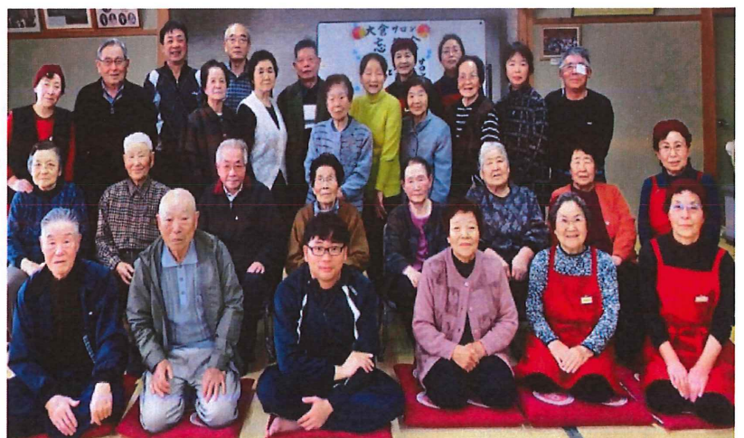
【大倉サロンの皆さん】☞